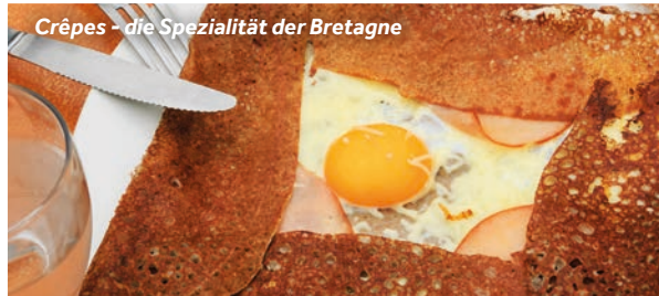
Crêpes – die Spezialität der Bretagne

Hafeneinrichtungen: Wasser, Strom, Toiletten, Duschen, WLAN