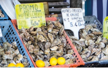
Bretonische Austern in La Roche-Bernard