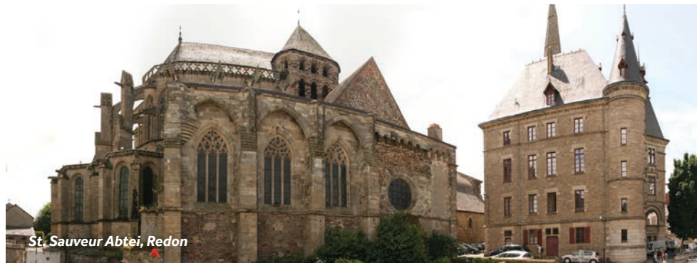
St. Sauveur Abtei, Redon

Restaurantempfehlung: La Bogue auf der Rue des États, im Stadtzentrum Einrichtungen vor Ort: Sie finden in Redon alles, was Sie brauchen – Supermärkte, Bäckereien, Metzgereien, zahlreiche Cafés und Restaurants. Wochenmarkt: Montag (vormittags) – Markthalle Hafeneinrichtungen: Wasser, Strom, Toiletten, Duschen - Gebührenpflichtig.