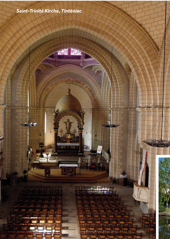
Saint-Trinité Kirche, Tinténiac

Hafeneinrichtungen: Wasser, Strom. Das Hafencenter befindet sich 800 m vom Le Boat Ponton entfernt: Duschen und Waschlöschen.