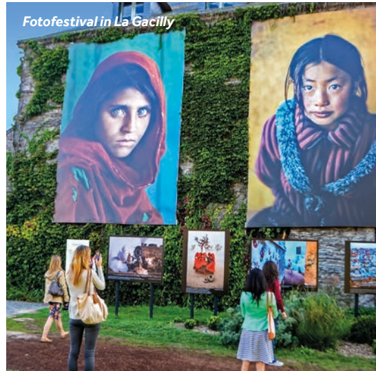
Fotofestival in La Gacilly

Restaurantempfehlung: Les Enfants Gât'chés, Rue la Fayette. Nur 2 Gehminuten vom Anleger entfernt. Einrichtungen vor Ort: Es gibt einen Supermarkt, Bäckereien, einen Metzger, Cafés und Restaurants. Wochenmarkt: Samstag (vormittags) Hafeneinrichtungen: Wasser, Strom