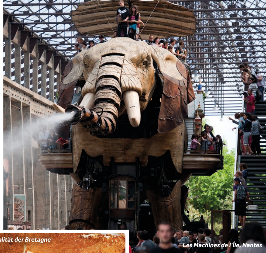
Les Machines de l'Île, Nantes

Wochenmarkt: Freitag (vormittags) – Place du Champ de Foire Le Boat Basis: Wasser, Strom, Toiletten, Duschen, WLAN