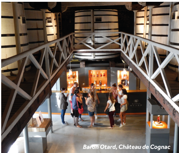
Baron Otard, Château de Cognac

Cognac ist international für seine Cognac-Produktion bekannt. Die Fassaden und Dächer sind mit einem leichten schwarzen Pilz bedeckt, der sich aufgrund der Verdunstung von Alkohol in der Luft bildet. Dies wird auch poetisch als ‚Produktions-Anteil der Engel‘ bezeichnet. In der Nähe des Yachthafens gibt es mehrere große Cognac-Handelshäuser, die Sie besichtigen können. Dort haben Sie auch die Möglichkeit, an Verkostungen teilzunehmen. Wir empfehlen einen Besuch und eine Besichtigungstour der Destillerie Baron Otard, die sich im Château de Cognac befindet, wo François I. geboren wurde. In Cognac können Sie zudem die Häuser von Salzhändlern, das großartige renovierte Kloster Récollets und eine Kirche aus dem 12. Jahrhundert mit romanischer Fassade entdecken. Besuchen Sie die großartige Touristeninformation und lernen Sie eine Vielzahl von Möglichkeiten kennen, die Stadt zu erkunden. Hier können Sie sich eine Broschüre mit dem Namen ‚Laissez-vous conter Cognac‘ (Entdecken Sie die Welt des Cognac) mitnehmen. Diese enthält ein Programm mit sechs empfehlenswerten Attraktionen.