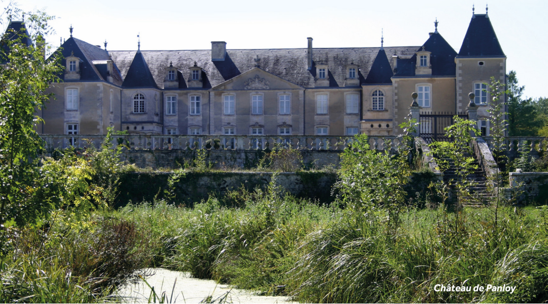
Château de Panloy