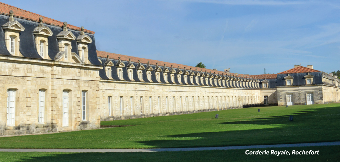
Corderie Royale, Rochefort