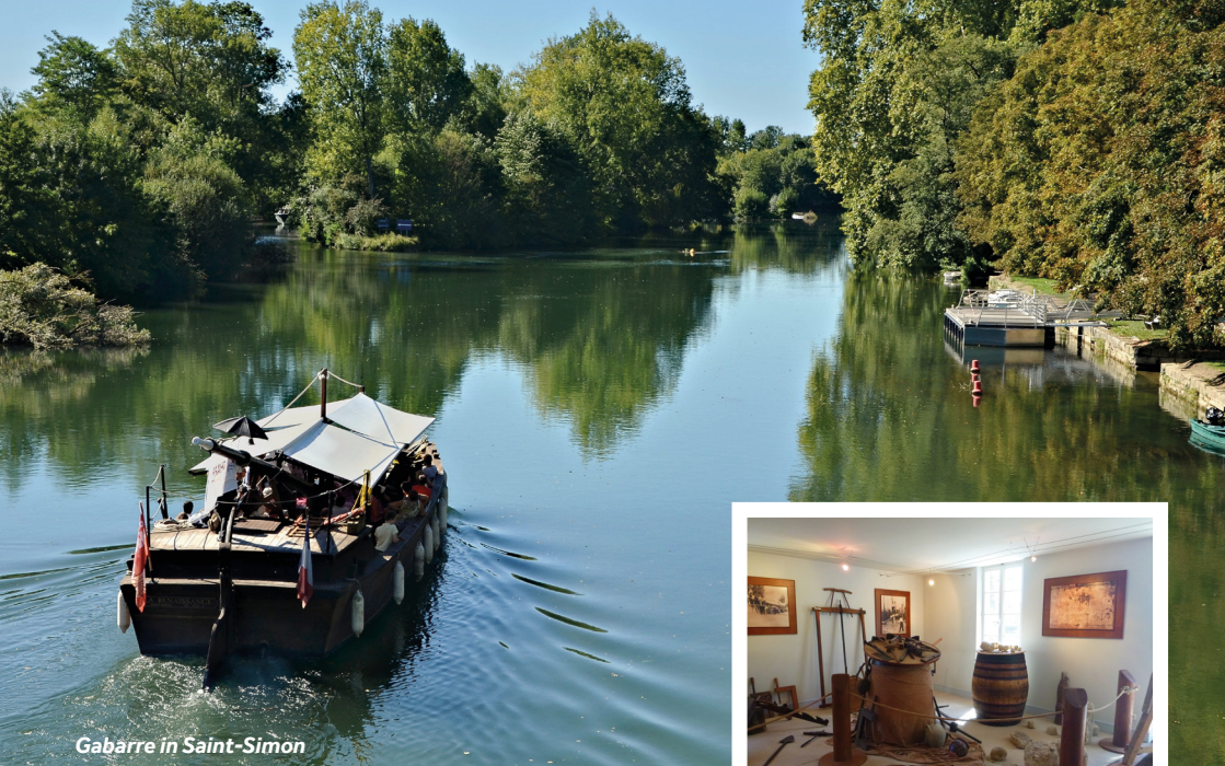
Gabarre in Saint-Simon