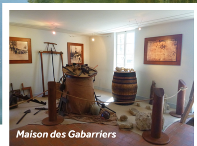
Maison des Gabarriers