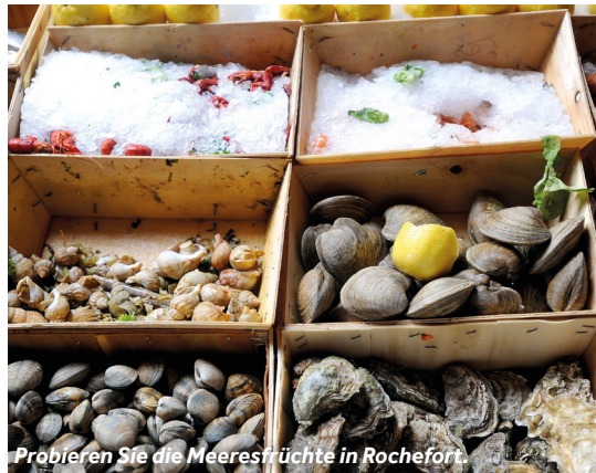
Probieren Sie die Meeresfrüchte in Rochefort.

Wochenmarkt: Dienstag, Donnerstag und Samstag (vormittags) – Avenue Charles de Gaulle und Les Halles