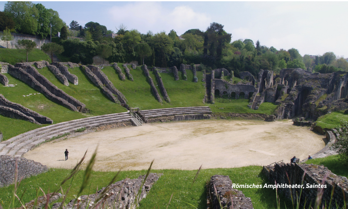
Römisches Amphitheater, Saintes

Restaurantempfehlung: Les Saveurs de l'Abbaye – neben der Abbaye aux Dames Einrichtungen vor Ort: Hier finden Sie einen Metzger, Bäckereien, einen Supermarkt, mehrere Cafés und viele Restaurants. Wochenmarkt: Dienstag bis Sonntag (vormittags)