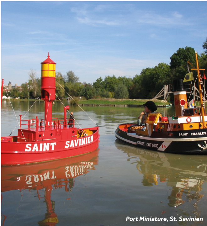
Port Miniature, St. Savinien