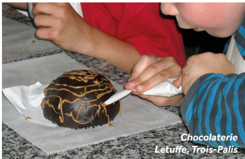
Chocolaterie Letuffe, Trois-Palis

Einrichtungen vor Ort: Hier finden Sie eher weniger Geschäfte und Restaurants, dafür aber großartige Schokolade!