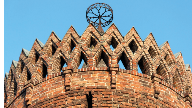
Mittelalterlicher Turm, Brandenburg an der Havel