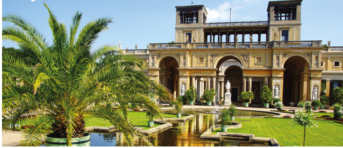
Orangerie im Schloss Sanssouci, Potsdam