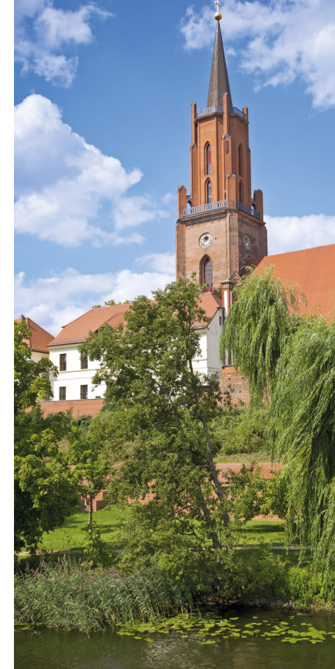
St. Marien-Andreas Kirche, Rathenow

Wochenmarkt: Dienstag, Mittwoch, Freitag und Samstag