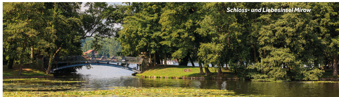
Schloss- und Liebesinsel Mirow

Restaurantempfehlung: Hotel und Restaurant „An der Seepromenade“ Einrichtungen vor Ort: Bäckerei, Metzger, Bank