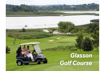
Glasson Golf Course

Am Südostufer von Lough Ree befindet sich der Glasson Golf Club mit Blick auf die herrliche Seenlandschaft. Im nahen Hudson Bay gibt es den Athlone Golf Club, der bereits viele Male vom Irischen Golfverband für zahlreiche Turniere aller Leistungsklassen gewählt wurde.