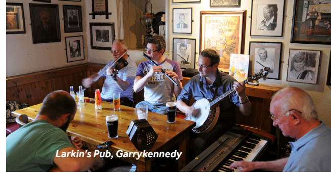
Larkin's Pub, Garrykennedy