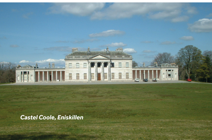
Castel Coole, Enniskillen

Enniskillen Golf Club ist nur wenige Gehminuten vom Stadtzentrum entfernt. Dieser herrliche 18-Loch-Platz bietet eine hervorragende Aussicht auf die Stadt und die umliegende Landschaft.