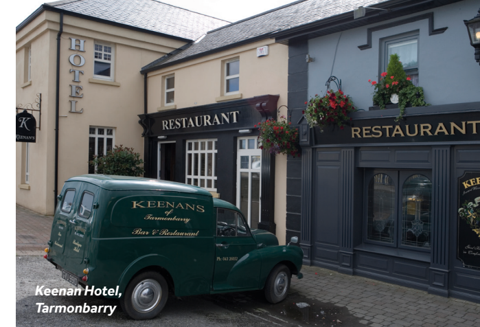
Keenan Hotel, Tarmonbarry

Restaurantempfehlung: Cox's Steakhouse auf der Harbour Road, eine kurze Strecke von Dromod Harbour entfernt