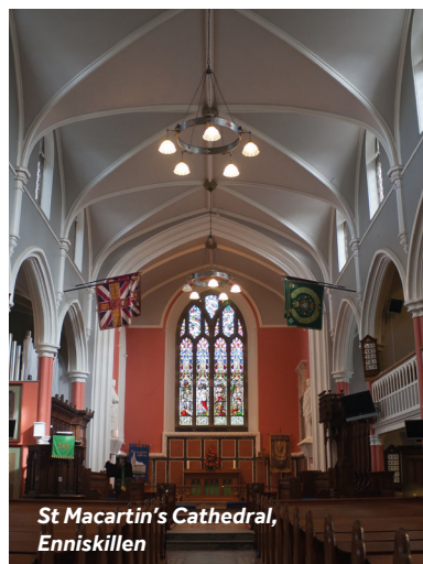
St Macartin's Cathedral, Enniskillen

Einrichtungen vor Ort: Hier finden Sie alles, was sie brauchen – Geschäfte, Supermärkte, Apotheken, Bäckereien, Metzger, Cafés und Restaurants.