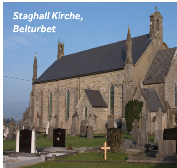
Staghall Kirche, Belturbet