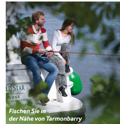
Fischen Sie in der Nähe von Tarmonbarry

Einrichtungen vor Ort: Hier gibt es einen Supermarkt und eine Apotheke.