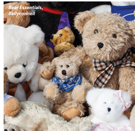
Bear Essentials, Ballyconnell

Einrichtungen vor Ort: Hier gibt es einen Supermarkt, Metzgereien und eine Apotheke.