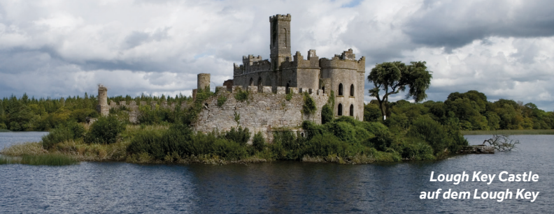
Lough Key Castle auf dem Lough Key