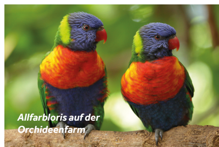
Allfarbloris auf der Orchideenfarm

Die sich in Luttelgeest befindende Orchideenfarm (Orchideeënhoeve) ist ein absolutes Muss auf dieser Strecke. Die vielen wunderbaren Orchideen und Schmetterlinge sind eine Augenweide. Schlendern Sie durch den malaysischen Garten, dem Schmetterlingstal und dem neuen Lori-Garten voller farbenfroher Allfarblori. Kinder können sich auf dem Mangrovenspielplatz austoben.