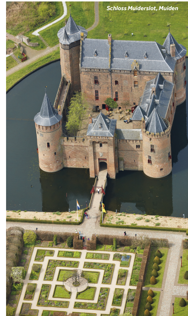
Schloss Muiderslot, Muiden