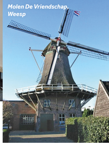
Molen De Vriendschap, Weesp