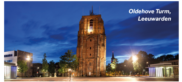
Oldehove Turm, Leeuwarden

Markt: Freitag (9:00-17:00 Uhr) – Wilhelminaplein