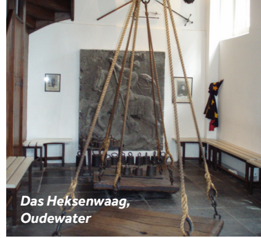
Das Hexenwaag, Oudewater

Oudewater ist eine der ältesten Städte der Niederlande mit rund 250 denkmalgeschützten Gebäuden. Sie werden von den kleinen Boutiquen und Restaurants begeistert sein. Doch die Hauptattraktion des Ortes ist die Hexenwaag. Hier fanden im 16. Jahrhundert die Hexenprozesse statt. Dazu wurden die mutmaßlichen Hexen auf eine Waage gestellt. Ging ihr Gewicht über eine gewisse Höchstgrenze hinaus, wurden sie für zu schwer befunden, um auf einem Besen zu reiten, und konnten daher keine Hexen sein. Bestanden sie die Prüfung, erhielten sie als Nachweis ein offizielles Zertifikat. Im Hexen-Waaghaus gibt es ein kleines Museum, das dieser facettenreichen Vergangenheit gewidmet ist.