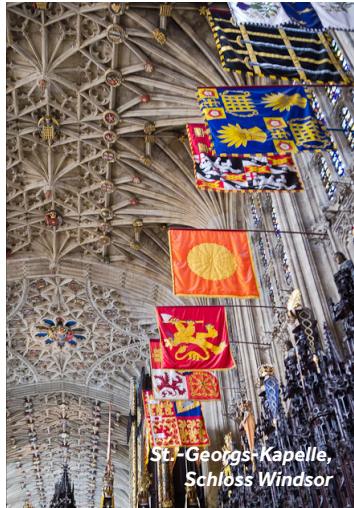
St.-Georgs-Kapelle, Schloss Windsor

Eine belebte Stadt mit vielen Geschäften, Supermärkten und Restaurants