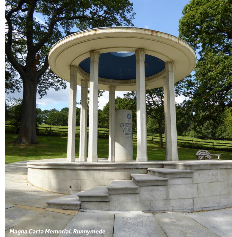
Magna Carta Memorial, Runnymede

König Johann traf sich vor fast 800 Jahren mit einer Gruppe von Baronen auf Magna Carta Island in Runnymede. Hier unterzeichnete er die Magna Carta, die von vielen als symbolischer erster Schritt auf dem Weg zur modernen Demokratie angesehen wird. Legen Sie an den Ufern direkt vor dem Runnymede Vergnügungspark an (eine geringe Gebühr fällt an). Sie werden in der Entfernung das Magna Carta Memorial sehen. Passen Sie auf, wenn Sie die befahrenen Straßen überqueren, und gehen Sie über das Feld auf das Denkmal zu. Das an einem sanften Hang mit Blick auf die Themse gelegene Denkmal ist der perfekte Ort für eine Pause und erinnert an den ständigen Kampf für die Freiheit.