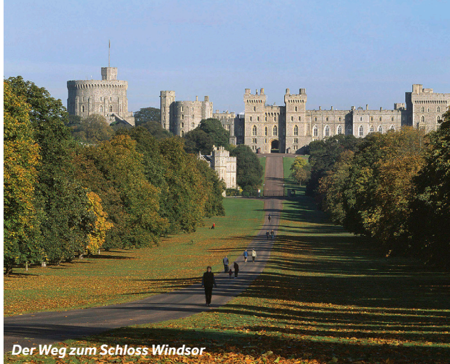
Der Weg zum Schloss Windsor

Die königliche Stadt Windsor und ihre Nachbarstadt Eton sind voller Geschichte und Charme. Es lohnt sich, hier einen Tag lang Halt zu machen, um das Stadtzentrum voller Geschäfte und unzähliger Restaurants, Cafés und Bars zu erkunden. Das Schloss Windsor ist das älteste und größte bewohnte Schloss der Welt und seit fast 1.000 Jahren das Zuhause britischer Könige und Königinnen. Achten Sie auf die königliche Flagge, die auf dem Rundturm gehisst wird, wenn die Königin anwesend ist. Im Inneren befinden sich die Prunkgemächer, deren Wände mit einigen der schönsten Kunstwerke der Welt, wie Rembrandt und Rubens geschmückt sind. Bestaunen Sie die schiere Pracht und den königlichen Glanz der mehr als 20 Zimmer. Planen Sie die Uhrzeit Ihres Besuch entsprechend, damit Sie die „Wachablösung“ nicht verpassen – ein farbenfrohes und musikalisches Spektakel der britischen Art. Die 45-minütige Zeremonie findet montags bis samstags von April bis Juli um 11 Uhr und in den anderen Monaten alle zwei Tage auf dem Schlossgelände statt.