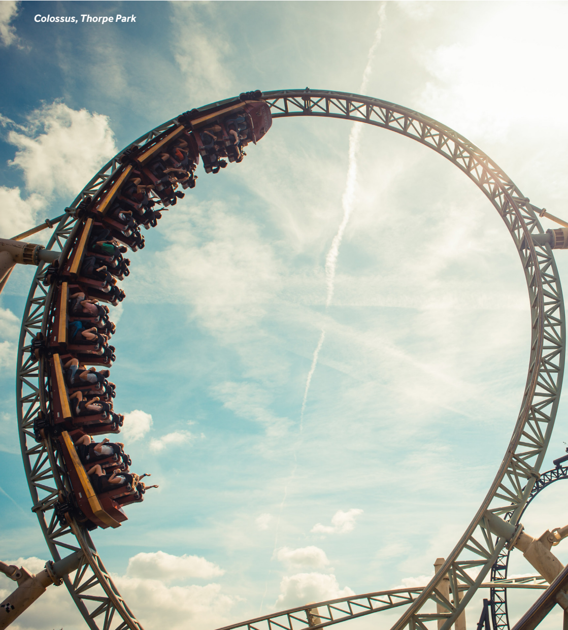
Colossus, Thorpe Park